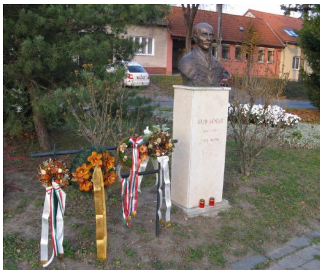
A költő szobra

Az esemény zárásaként meghirdettük a Sajó Sándor Emlékévet . 2018-ban lesz a költő születésének 150., halálának 85. évfordulója.