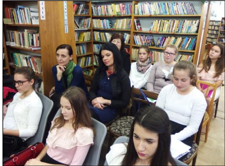
Versmondók és felkészítők

A „Magyarnak lenni: nagy s szent akarat!” címen futó magyar költők hazafias költeményeinek idei szemléjére összesen tizenheten jelentkeztek. De kevesen! – sóhajthatnánk fel. Sóhajthatunk akármennyit, azzal előbbre nem jutunk. Sok oka lehet ennek, töprenghetnénk rajta naphosszat. Egyik oka nyilvánvaló: a hazafiság mint erkölcsi fogalom „kiment a divatból”. Az egyéni érdek, a karriervágy, a valósítsd meg önmagad, a nyugatimádat – hosszan sorolhatnánk! -, amivel óránként szembesül az ember, az ifjúság is, a rontás, a rombolás szelleme, amely a „példakép” nyugatról árad felénk... Pedig tudhatnánk, mi magyarok kiváltképp, hogy: „hittél a nyugatnak, mindenkor becsaptak”(idézet a Tartsd magad nemzetem című, elhallgattatott dalból ). Inkább örülhetünk annak, hogy 17 magyar fiatal kezébe vette Sajó Sándor verskötetét vagy kereste azokat a világhálón s megtanulta Illyés Gyula, Wass Albert, Gyurcsó István, Váci Mihály, Ábrányi Emil, Babits Mihály, Majthényi Flóra, Márai Sándor, Reményik Sándor, Móricz Zsigmond, Kardos Győző, Petőfi Sándor, Deák L. Olivér stb. egy-egy költeményét. Megtanulta s előadta, az értékelő bizottság véleménye szerint: kitűnően. Ebben nyilván nagy szerepe van az őket felkészítő tanároknak (Szikora Andrea, Zolczer Andrea, Cseri Bernadett, Renczés Nóra, Károlyi Andrea, Viczencz Gábor, Németh Ágota), sőt nem egy esetben a szülőknek is.