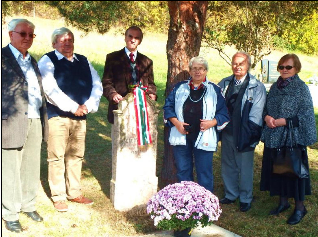
Az író dédszüleinek sírjánál