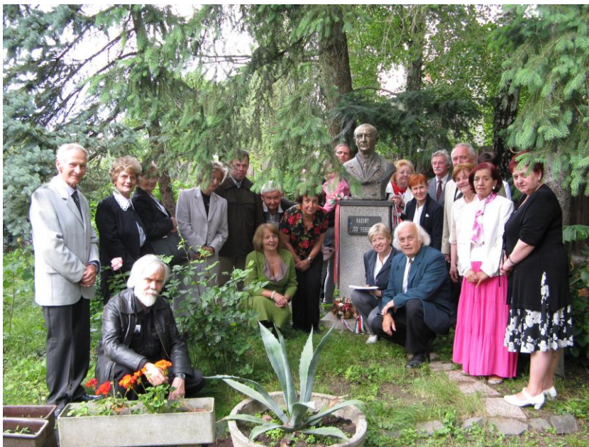
A résztvevők (2014)