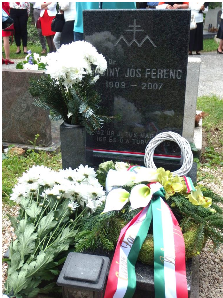
Nyugvóhelye a Farkasréti temetőben (2019)