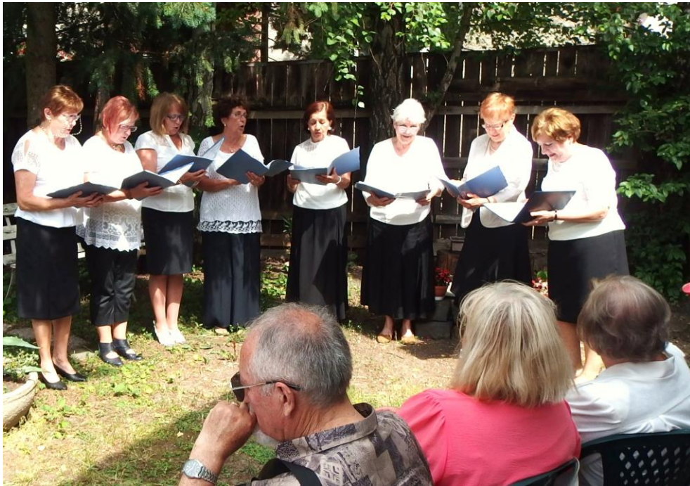
A Csemadok Losonci Alapszervezet énekkara (2018)